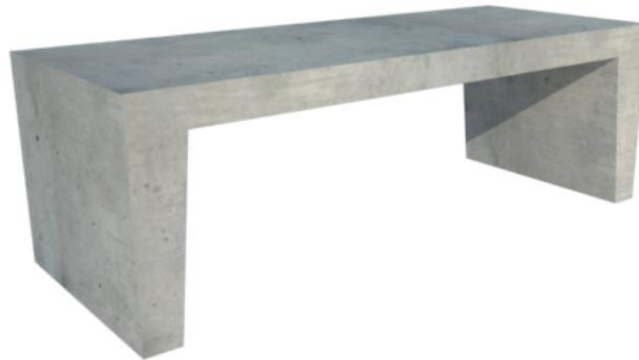
BANCO 3C Peso: 350 kg. Medidas: 150X50X60 cm. Diseñado para 3 personas.

Los bancos cuentan con insertos metálicos para la vinculación con la estructura soporte mediante hormigonado in situ. Se incluirá en el precio del ítem todos los trabajos necesarios para el traslado, movimiento en Obra, excavación, colocación, alineación, nivelación y fijación de los bancos anteriormente mencionados.