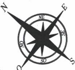
ESQUEMA DE UBICACIÓN BARRIO EST. SAN ISIDRO